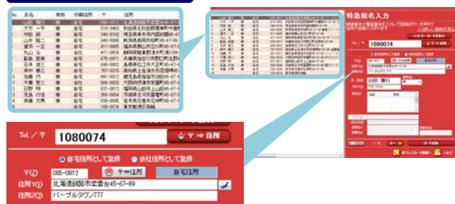
郵便番号か電話番号から住所が自動表示