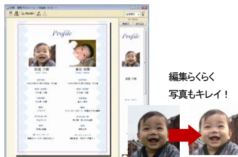
編集らくらく 写真もキレイ！

アイテム別にカテゴリ分けされた見やすいガイドブックが付いています。手作りでもキレイに作るコツやワンポイントマナー集、個々のスタイルにあわせたアイテム組み合わせ例など、ペーパーアイテム作りに役立つ情報が満載。あなたのペーパーアイテム作りをお手伝いします。収録デザインを一覧できる「デザインカタログ」もついてデザイン選びもらくらくできます。