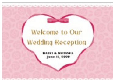
＜キュート＞ ～リボンハート～