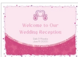
ウェルカムボード