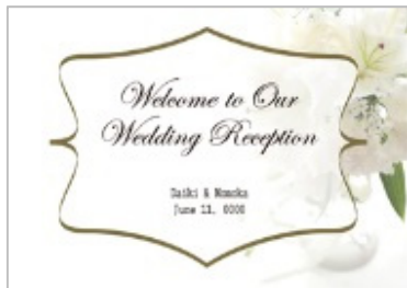
＜エレガント＞ ～カサブランカ～

エレガント:8 テーマ / ナチュラル:4 テーマ / ジャパニーズ:6 テーマ / キュート:2 テーマ / スタイリッシュ:6 テーマ