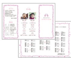
表紙/席次表(三つ折り)

ウェルカムボード、招待状【表紙】、招待状【文面】、返信用はがき、追伸カード、席札、メッセージカード、三つ折り表紙(ごあいさつ、プロフィール、メニューを含む)、三つ折り席次表、結婚証明書、立会人シート、二次会案内、二次会返信はがき、結婚報告はがき