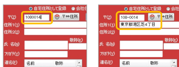
郵便番号を入力すると

招待状作りに必要な住所録が、かんたん入力で手早く作成できます。郵便番号を入力するだけで、該当する市町村までを自動表示するので、初心者でも手間なく住所録が完成します。返信用はがきの敬称設定もらくらく。一覧表で印刷すれば、招待客リストとしても使用できます。作った住所録は、結婚式・披露宴後の報告はがきや、報告兼用年賀状を作る際に活用できます。