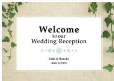
＜ナチュラル＞ ～アイビー～