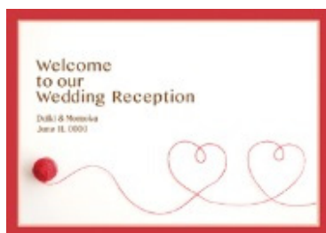
＜スタイリッシュ＞ ～赤い糸～